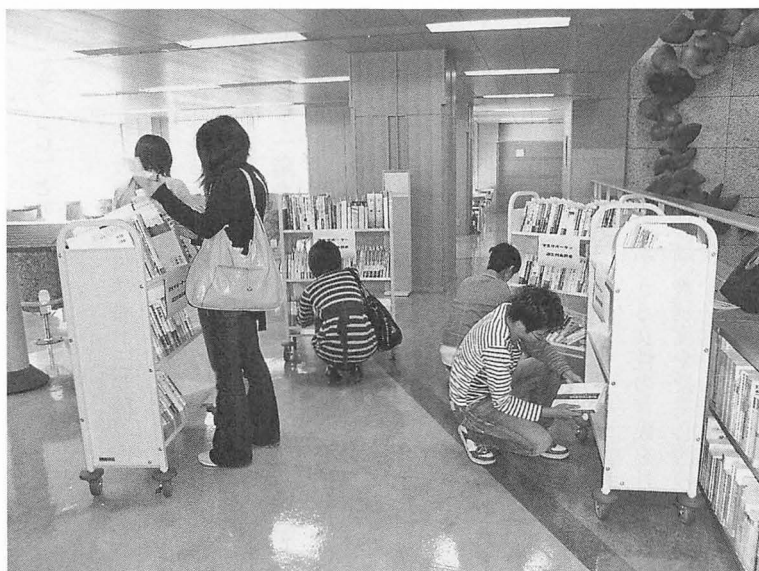
学生の選書している様子

実は最初に「キノコレ」を紹介された時、筆者を含め館員一同まったく興味を示さなかった。というのも、配本された本はすべて購入することが前提だと言われたからだ。選書をするということは図書館司書の専門業務だと自負しているので、人に薦められるまま本を買うことなどできない、と強く反発した。しかしながら、よくよく考えると配本してくれる本はすべて学術系の図書で、学生がリクエストしてくる非学術系の本に比べれば、たとえどれが入ったとしても究極は構わないのではないか、という考えに至ったのだ。